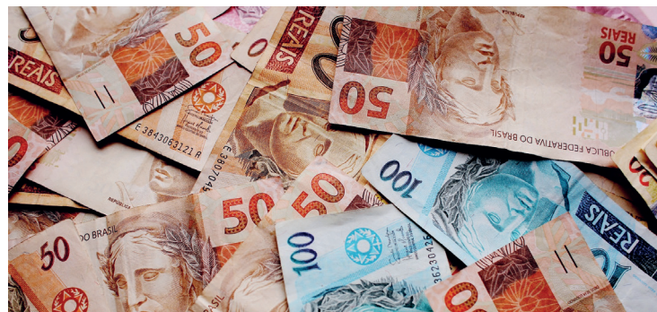
Tabela de Imposto de Renda tem defasagem de 157%, mesmo com isenção até R$ 5.000

Apesar da desvalorização no ranking elaborado pela Elos Ayta, o dólar ainda tem variação positiva de 2,25% no índice DXY, que o compara com seis moedas consideradas fortes: o euro, o iene, a libra esterlina, o dólar canadense, a coroa sueca, franco suíço. Isto é Dinheiro