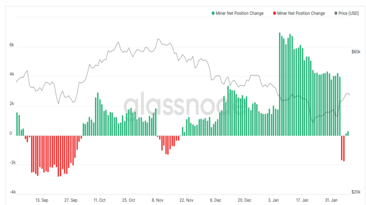
Bitcoin: Miner Net Position Change